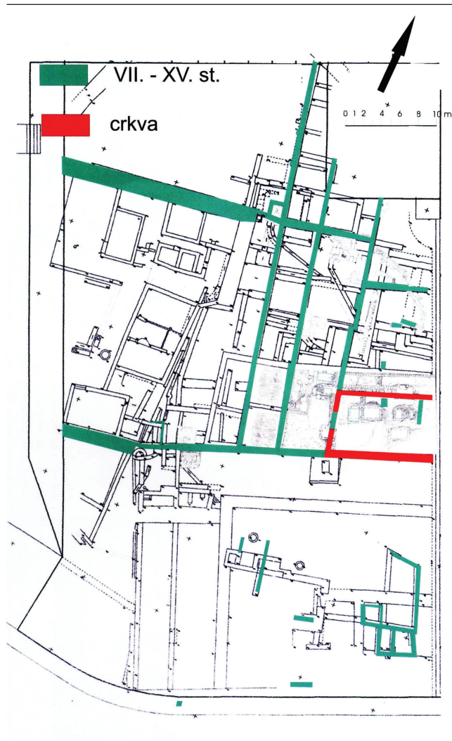
Sl. 2 Tlocrt ranokršćanske i predromaničke crkve (Starac 2011e, 37).

Fig. 2 Ground plan of the early Christian and pre-Romanesque churches (Starac 2011e, 37).