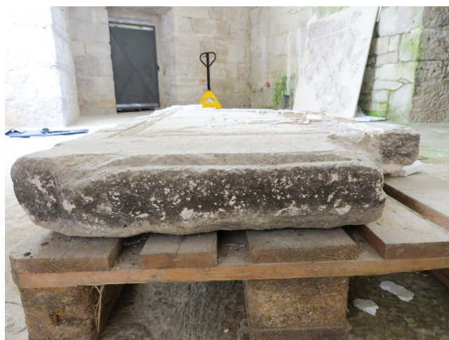
Sl. 4 Bočna strana ploče (foto: I. Juričić).

corner there are trefoils directed towards the cross, and the central position of the edge of the steplike profile shows a branch with leaves with a dove on it. The latter motifs were made by almost engraving the stone surface. The leaves are emphasized in the middle, in order to achieve greater realism of the motif, and the beautifully depicted dove, with a rounded head and a short beak, has emphasized feathers in the area of the tail, a wing, and an eye. The slab does not have a preserved connection (a pin) necessary for wedging into the pilaster (Fig. 4).