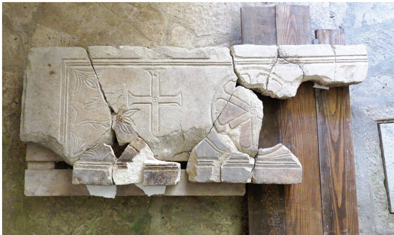
Sl. 3 Ranokršćanska kamena ploča iz četvrti sv. Teodora u Puli (foto: I. Juričić).