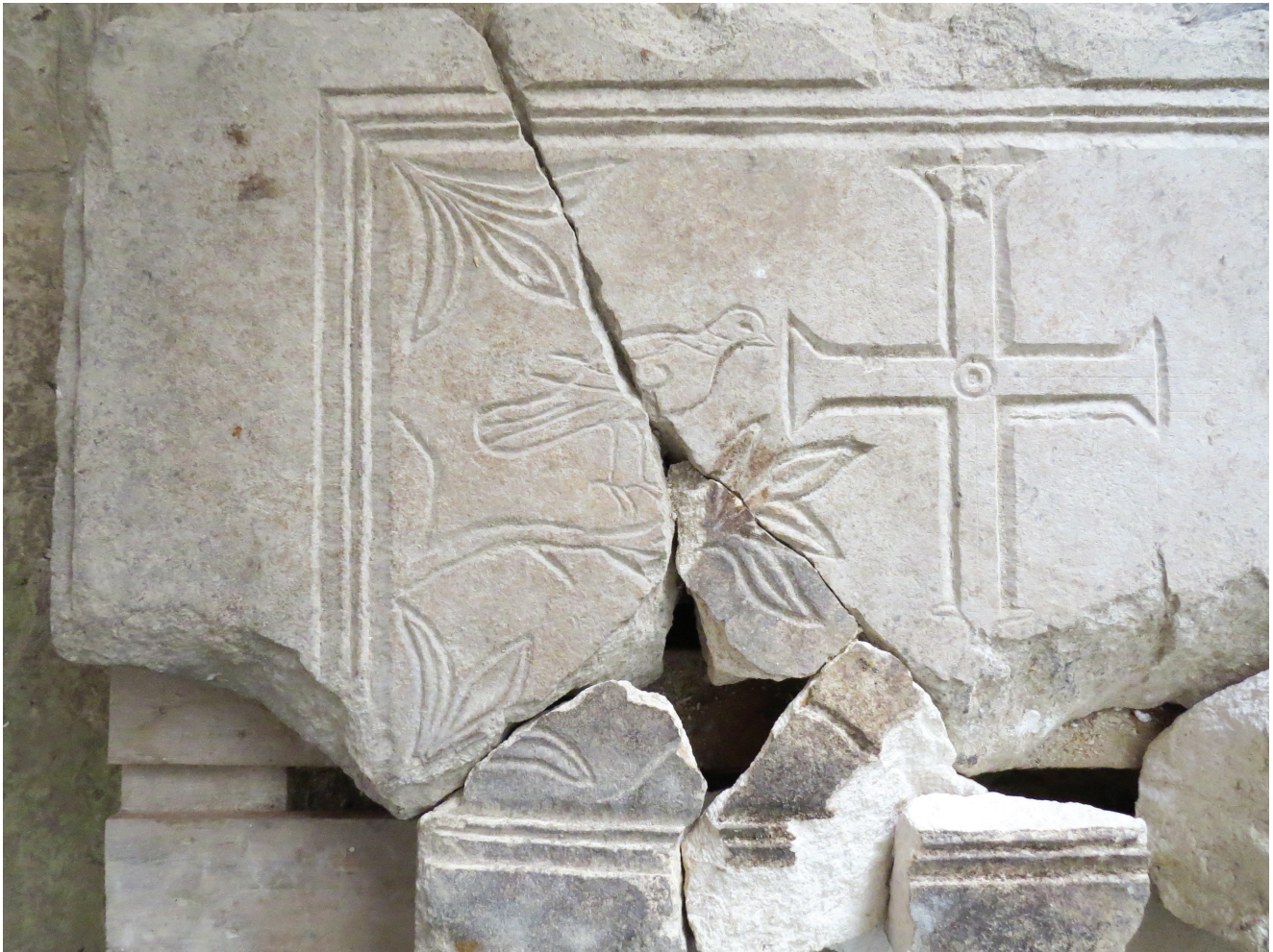
Sl. 5 Detalj ploče s prikazom golubice, grančice, trolista i križa.